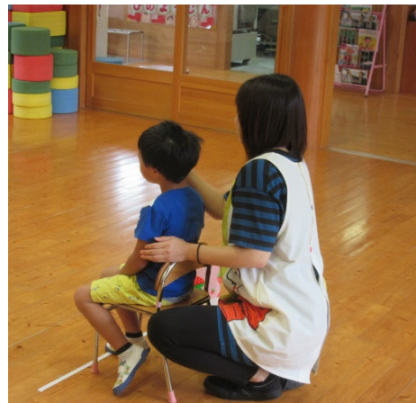
児童の片目を保育士さんが遮蔽